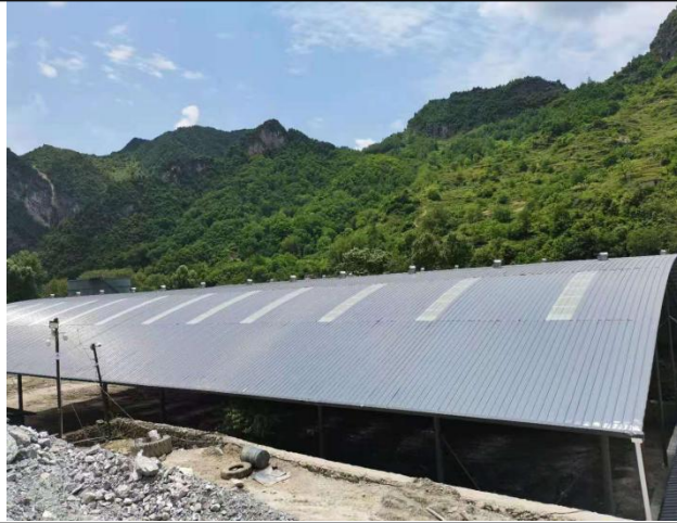
原料堆场、成品（最小粒径）堆场